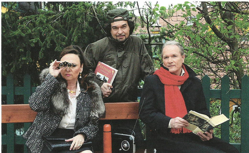
Die Darsteller von "Winterrose"

12. Mai 2016 09:53 Akt.: 12. Mai 2016 11:29